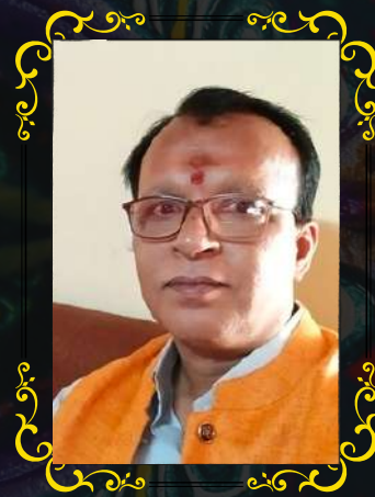
~ अनंत तेलंग

एकमेका साहा करू आस धरू लेखणीची, मनातल्या भावनांना साथ ही उजळणीची ...१०